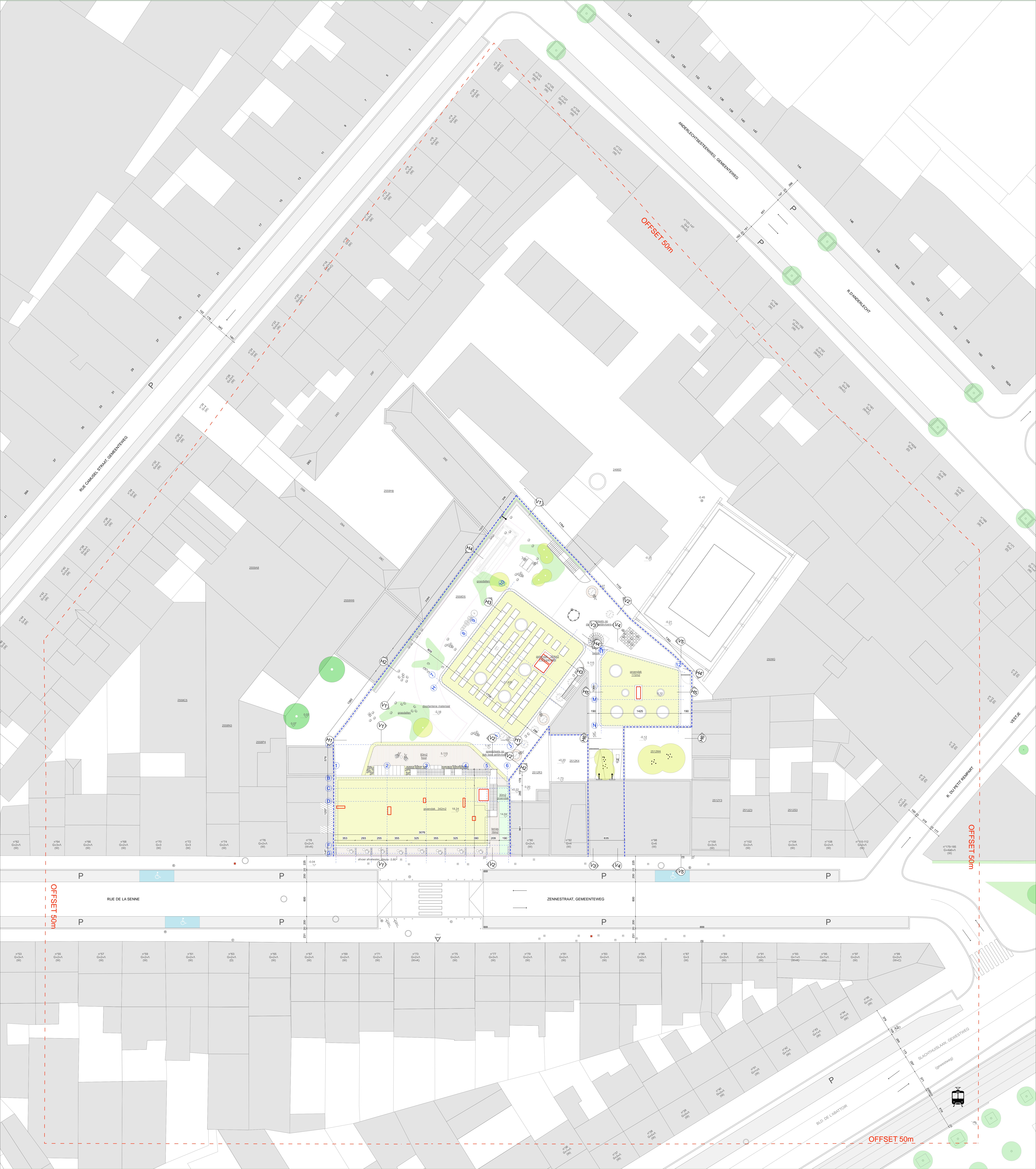
INPLANTINGSPLAN SCHAAL 1:200

Op dit inplantingsplan staat de nieuwe toestand (dakenplan, bemeting, hoogtepunten). De inplanting, hoogtepunten en de profielen van de bestaande bebouwing en opnamepunten foto's staan op plannen 2/22 (afbraak niveaus -1/+0, +1, +2 en +3) en 3/22 (afbraak dakenplan). Het terreinprofiel van de bestaande site en de doorsnede van bestaande bebouwing zijn op elke snede aangeduid met een rode stippellijn.