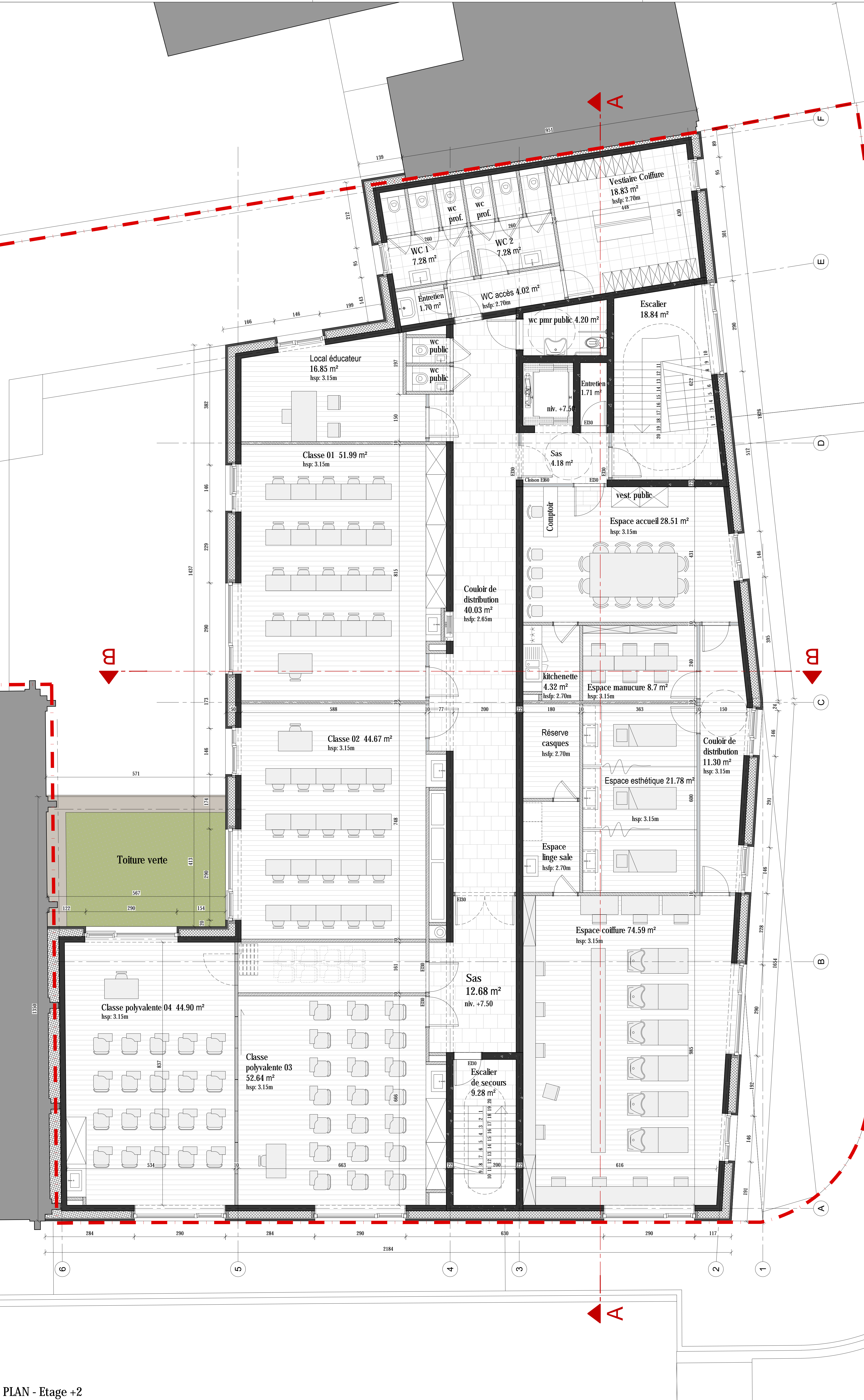
PLAN - Etage +2