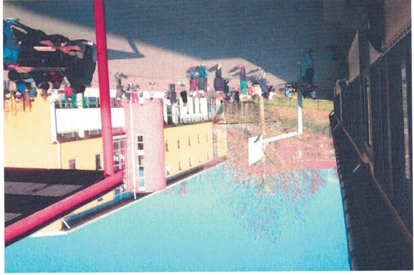
Photo 3 Vue vers la bâtiment principal

DEMANDE DE PERMIS D'URBANISME - PHOTOS DOSSIER : SAINTE JEANNE DE CHANTAL- Renouvellement des classes type container en cour arrière ADRESSE : Avenue Marcel de Thiry, 31 à 1200 Bruxelles