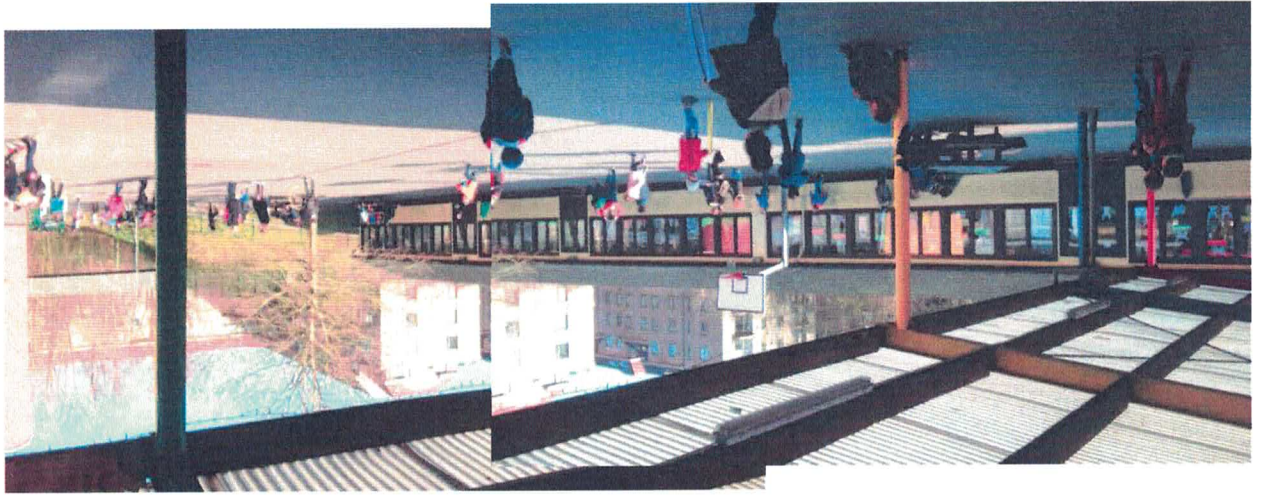
Photo 2 Vue vers les classes à renouveler