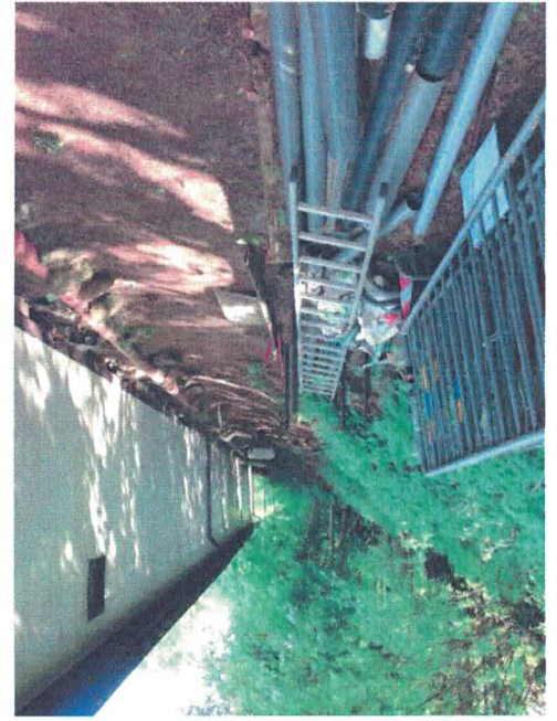
Photo 9 Vue à l'arrière des baraquements avant déboisement