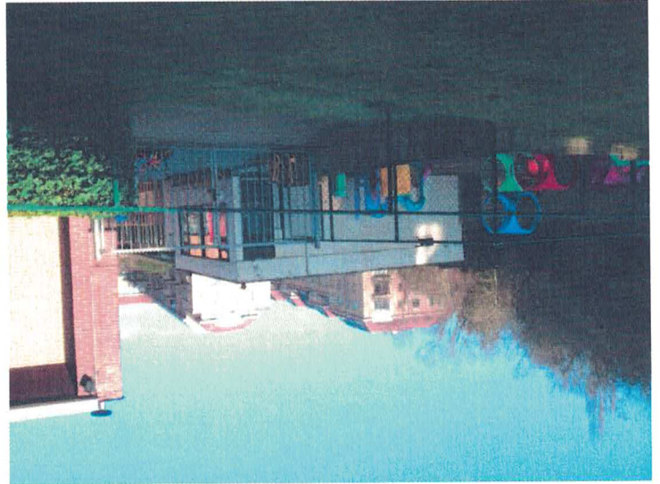
Photo 7 vue vers le container depuis la voirie latérale

DOSSIER : SAINTE JEANNE DE CHANTAL - Renouvellement des classes type container en cour arrière ADRESSE : Avenue Marcel de Thiry, 31 à 1200 Bruxelles