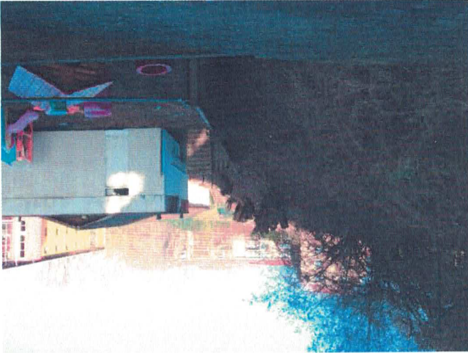
Photo 8 Vue à l'arrière des containers et baraquements