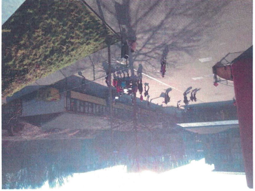
Photo 4 Vue générale de la cour et sur les baraquements à démolir