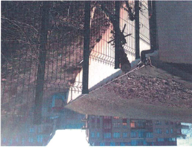
Photo 10 Vue à l'arrière des baraquements après déboisement