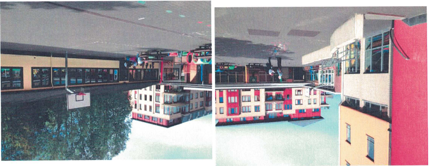
Photo 5 Vue vers le voisin gauche depuis la cour

D O S S I E R : SAINTE JEANNE DE CHANTAL- Renouvellement des classes type conteneur en cour arrière A D R E S S E : Avenue Marcel de Thiry, 31 à 1200 Bruxelles