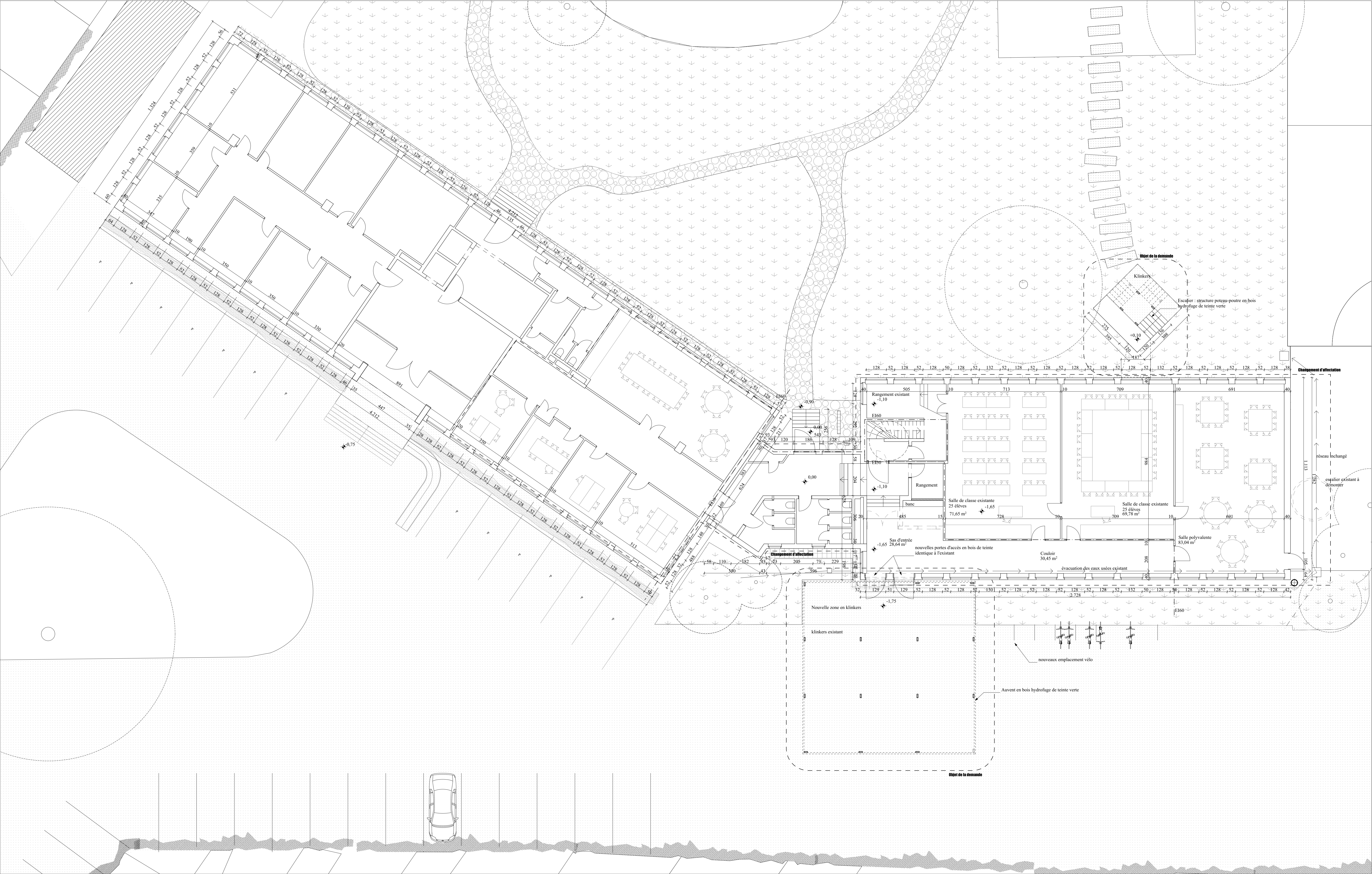
Plan Niv+0 - 1/100