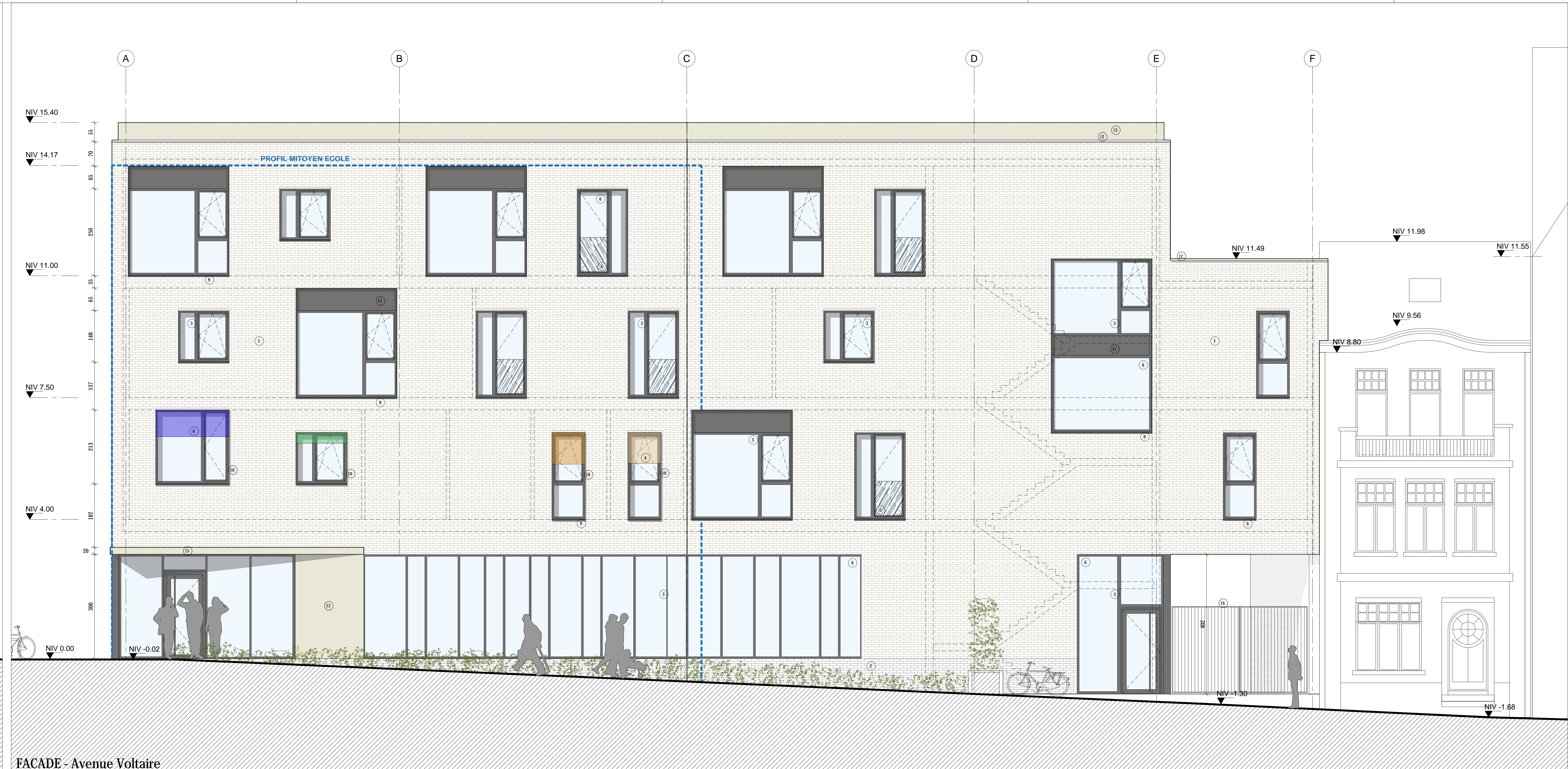
FACADE - Avenue Voltaire