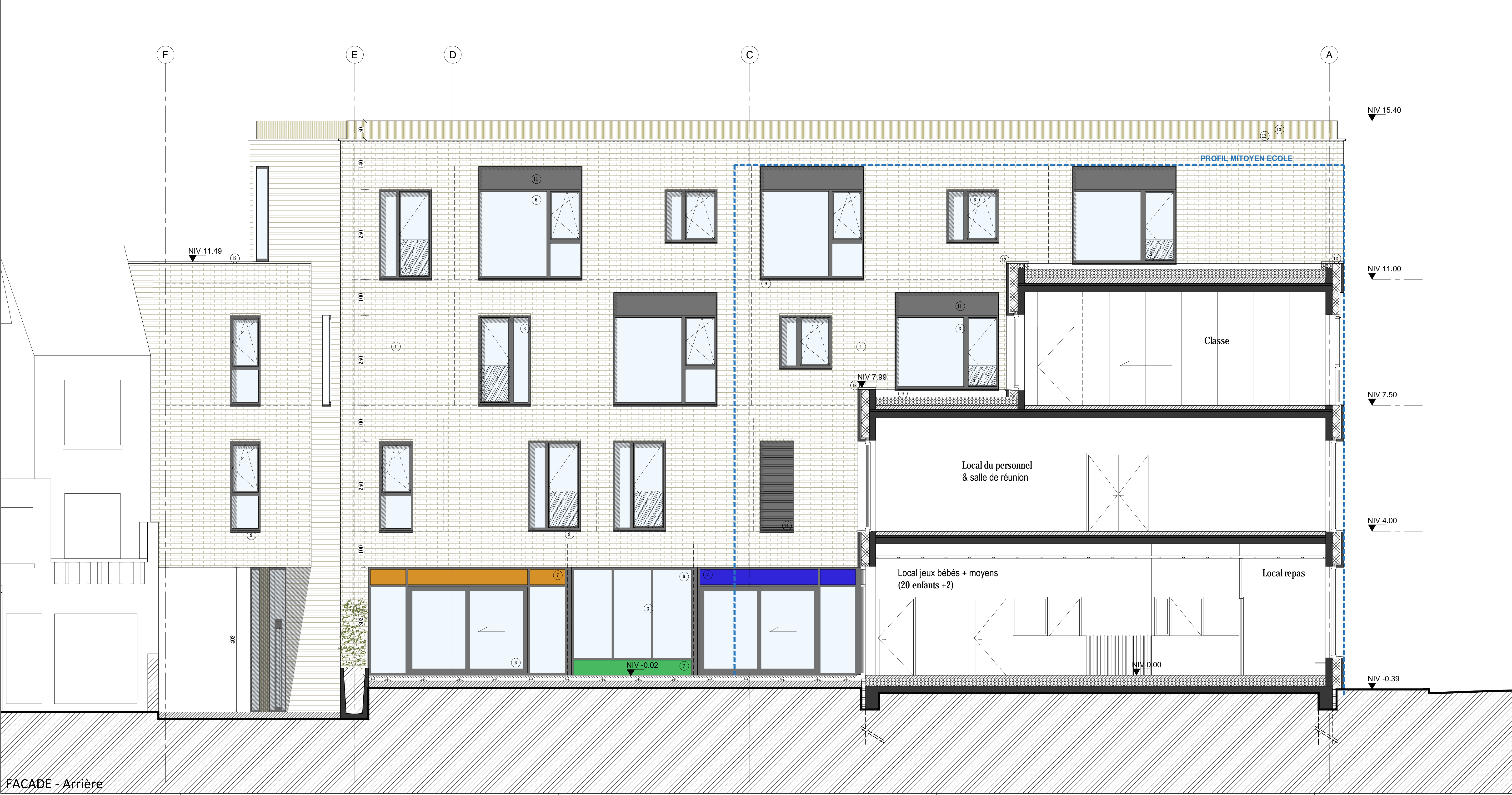
FACADE - Arrière