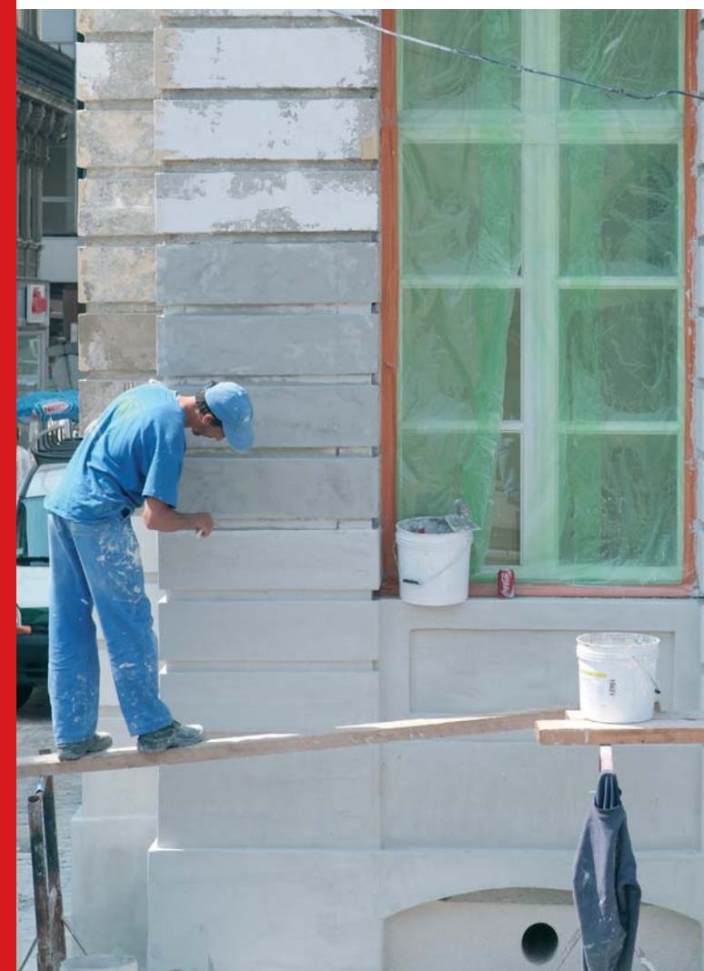
Veratmw. uitgever : Philippe Thiéry, CCN, Vooruitgangstraat 80/1, 1035 Brussel