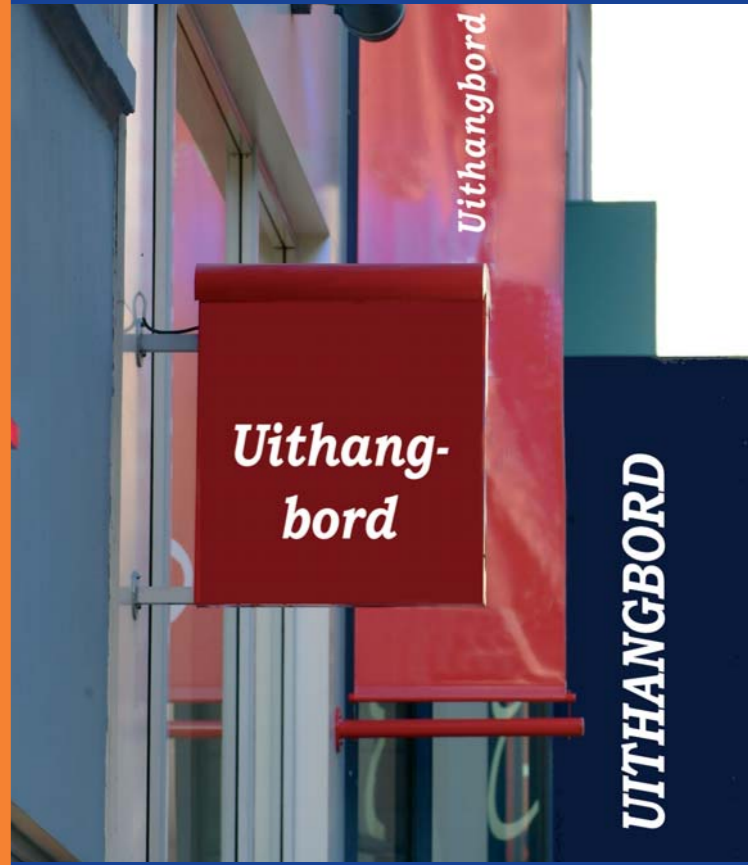
Veratnw. uitgever: Arlette Verkruyssen, CCN, Vooruitgangstraat 80/1, 1035 Brussel

De INFO-FOLDERS VAN STEDENBOUW verstrekken elementaire informatie. U vindt meer inlichtingen met betrekking tot uw goed of uw ontwerp bij de bevoegde diensten.