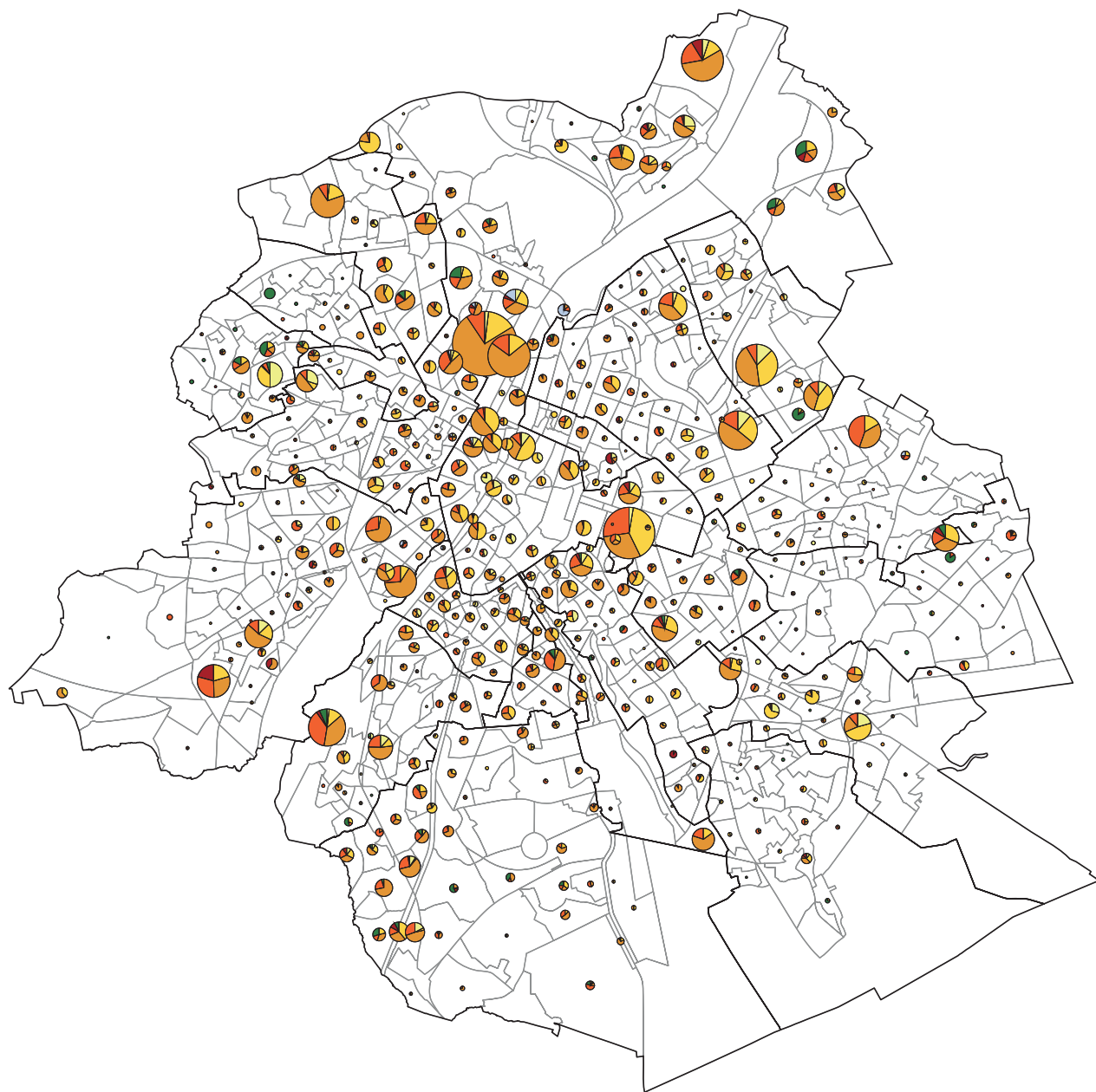
Fig. 5 | Vergunde woningen per type (2009-2011)

Nombre annuel moyen de logements autorisés par secteur statistique Gemiddeld jaarlijks aantal vergunde woningen per statistische sector